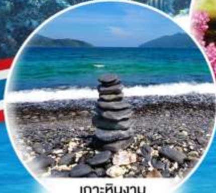
เกาะหินงาม