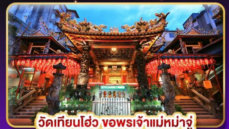
วัดเทียนโฮ่ว ขงพรเจ้าแม่มาจู่