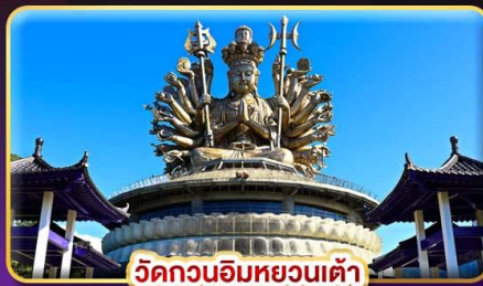
วัดกวนอิมหยวนเต๋า