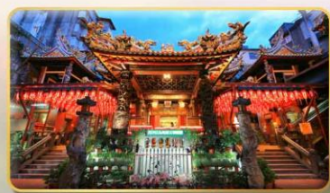
วัดเทียนฮั่ว จอพรเจ้าแม่หม่าจู