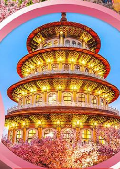
วัดจู้เทียนหยวน

ช้อปปิ้งจุใจ ย่านซีเหมินติง ตลาดโจงโนก่บมาร์เก็ต อิมอร่อยกับ..เมนูปลาประรานาธิบติ ซาบูบุฟเฟ่ต์สไตล์ไต้หวัน เสียวหลงเปา