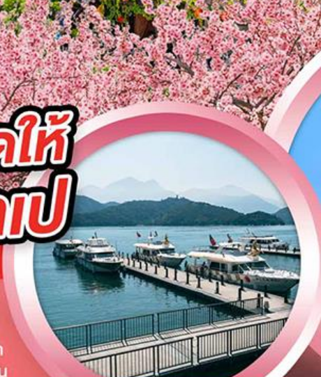
ล่องเรือทะเลสาบสุรียันจินทรา