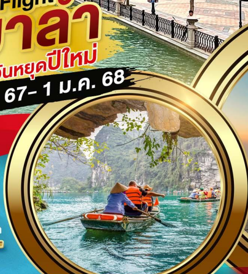
บิ่งห์บิ่งห์