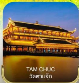
TAM CHUC วัดตามจุก