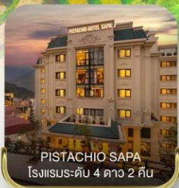
PISTACHIO SAPA โรงแรมระดับ 4 ดาว 2 คืน