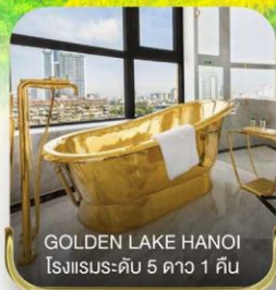
GOLDEN LAKE HANOI โรงแรมระดับ 5 ดาว 1 คืน