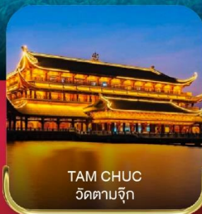
TAM CHUC วัดตามจึก